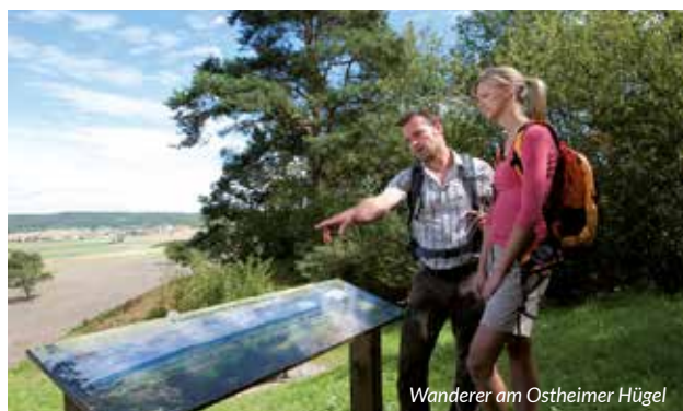
Wanderer am Ostheimer Hügel