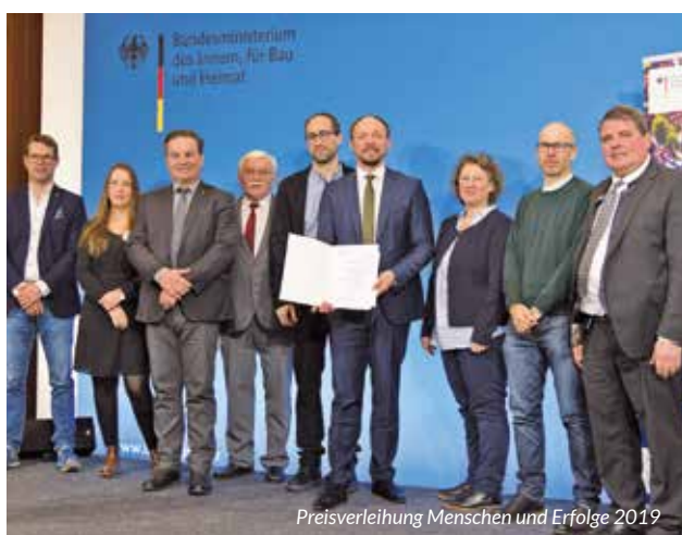
Preisverleihung Menschen und Erfolge 2019

29.01.2013 Frankenschau (Bayerischer Rundfunk, BR Fernsehen)