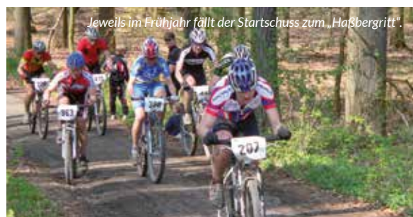
Jeweils im Frühjahr fällt der Startschuss zum „Haßbergtritt“.