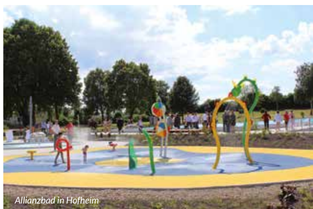
Allianzbad in Hofheim