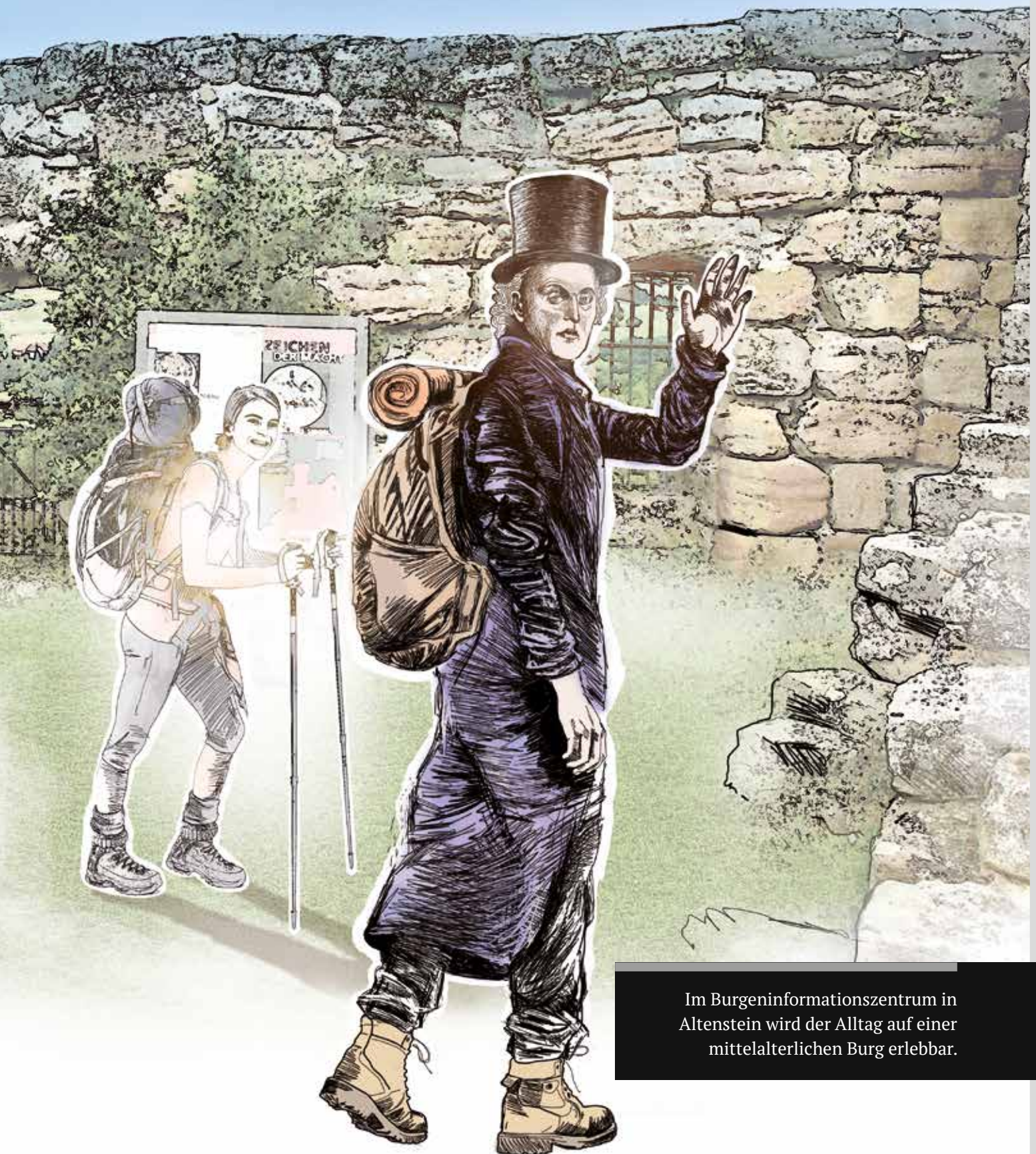
Im Burgeninformationszentrum in Altenstein wird der Alltag auf einer mittelalterlichen Burg erlebbar.