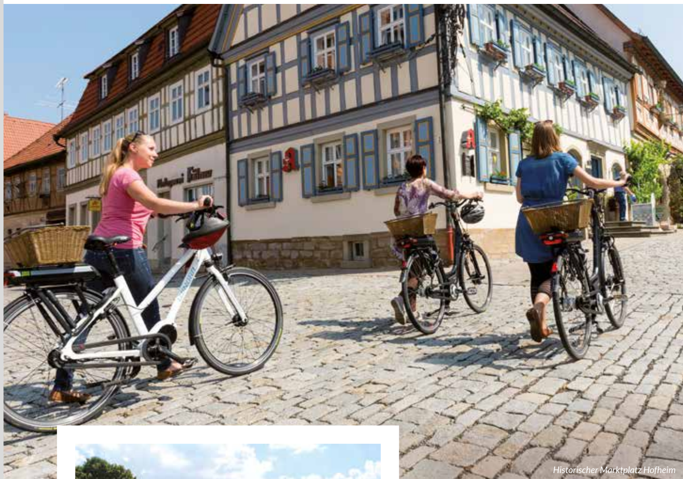
Historischer Marktplatz Hofheim