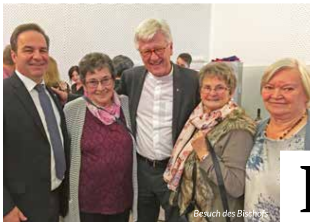
Besuch des Bischofs