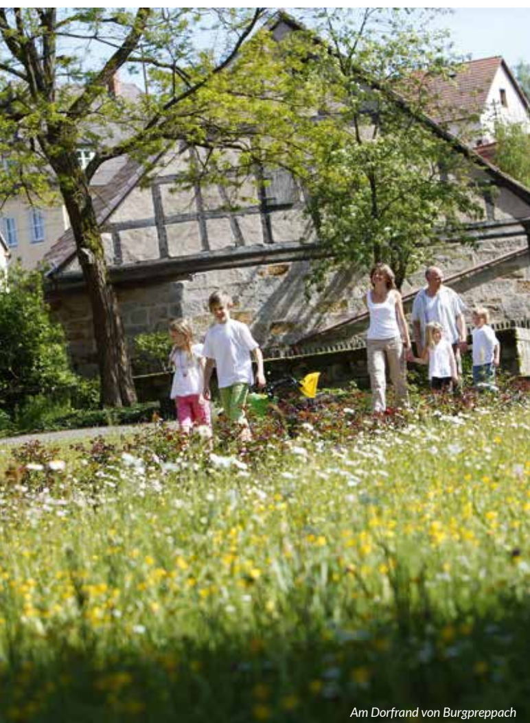
Am Dorfrand von Burgpreppach