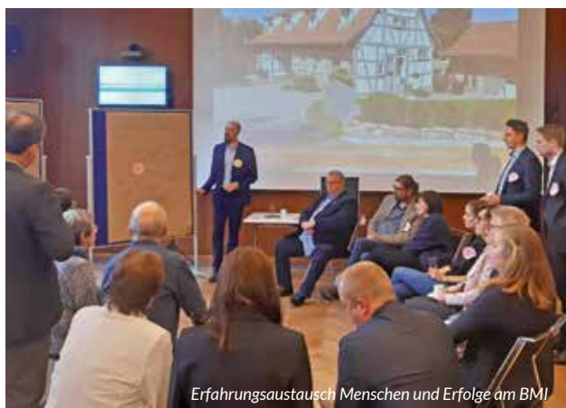
Erfahrungsaustausch Menschen und Erfolge am BMI