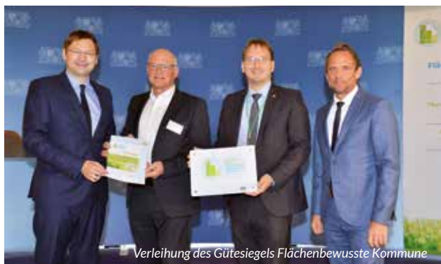
Verleihung des Gütesiegels Flächenbewusste Kommune