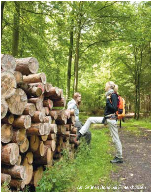
Am Grünen Band bei Ermershausen