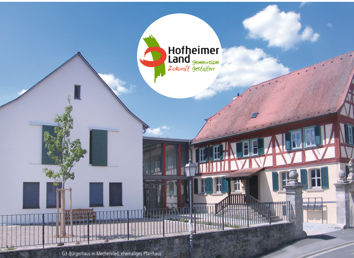
G3-Bürgerhaus in Mechenried, ehemaliges Pfarrhaus